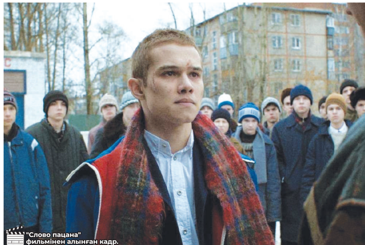
«Слово пацана» фильмінен алынған кадр.

Еліміздегі криминалдық ахуалға әсер ететін бір фактор — қоғамда криминалды романтизациялау екенін жоққа шығаруға болмайды. Қазір телеарналар мен платформаларда заңға қайшы қарақшылық, есірткі, рәкетірлік, қыз зорлау, кісі өлтіру тақырыптарды қозғайтын сериалдар көбейді.